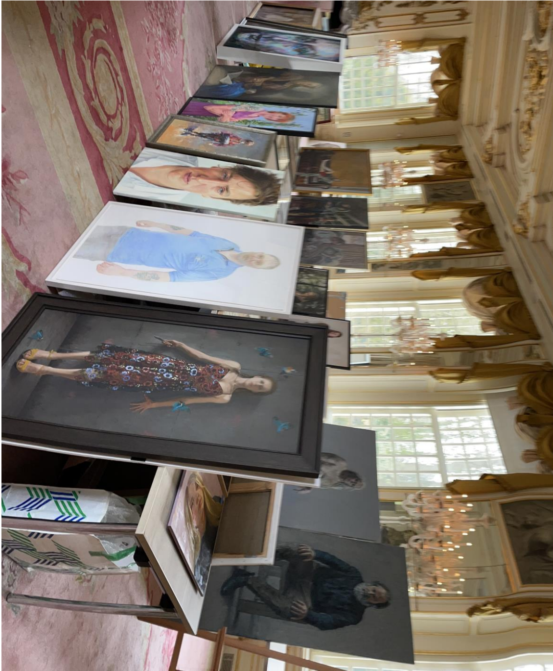
Selectie dag Nederlandse Portretprijs in 2023 in Slot Zeist.